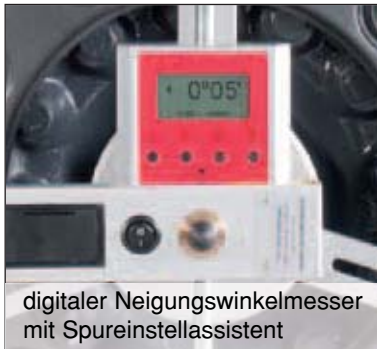
digitaler Neigungswinkelmesser mit Spureinstellassistent