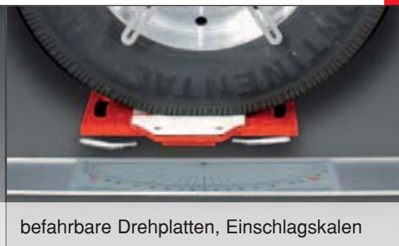
befahrbare Drehplatten, Einschlagskalen