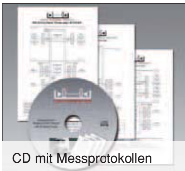
CD mit Messprotokollen