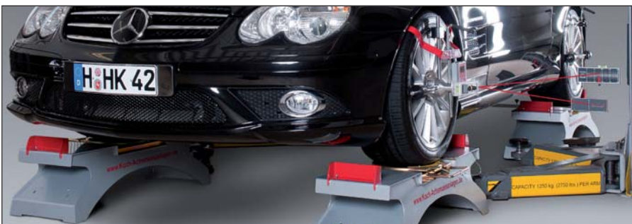
Vermessung in Verbindung mit einer 2-Säulen Hebebühne