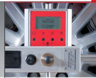
digitaler Neigungswinkelmesser mit Spureinstellassistent