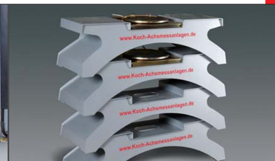
transportable und stapelbare Leichtmetall- Absetzrampen mit eingelassenen Drehplatten

Durch das Rollen des Fahrzeugs auf den Absetzrampen* wird der Fahrzustand erreicht.