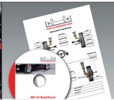
Spureinstellassistentz-Software inkl. Messprotokoll-Ausdruck