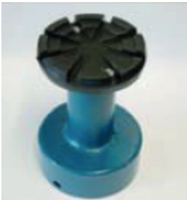
232HEL48081 · Starre Aufsatzgarnitur für den universellen Einsatz · 151mm · ø120mm · Satz = 4 Stk.